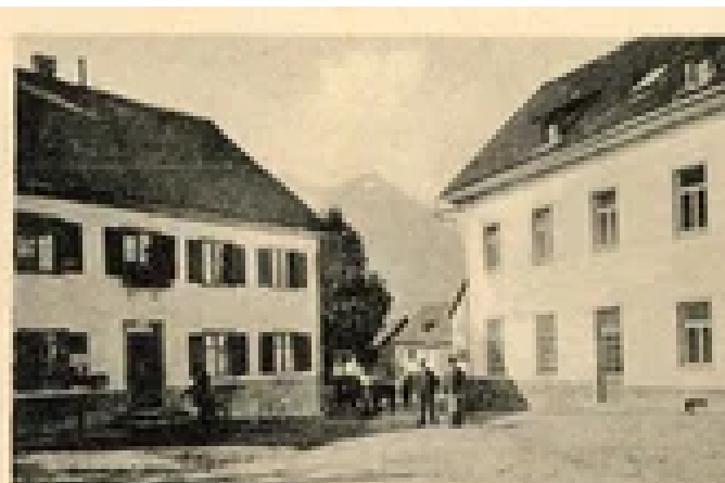
Partie bei der Krone